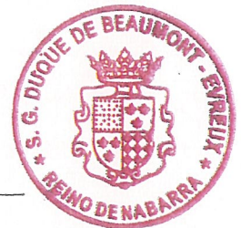
Blas de Beaumont

Nos vuelve a humillar con semejante bandera. Le pregunto, desde cuando el escudo de Armas de Navarra ostentó cadenas (?) no cesa de hacer el ridículo en tema cultural. Navarra jamás ostentó cadenas pero sí carbunclos o pomaladas, repase heráldica y evitará el ridículo. Espero que pronto desarloje dicho Consistorio y sea usted parte la Historia, lo que el viento se llevó, un político antoja dijo, caziquil he inepto, engreído.