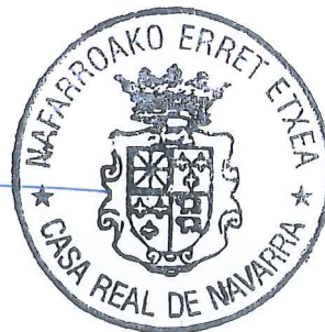
Blas de Beaumont.